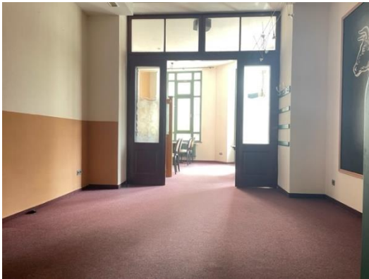
Gastraum 3 +4