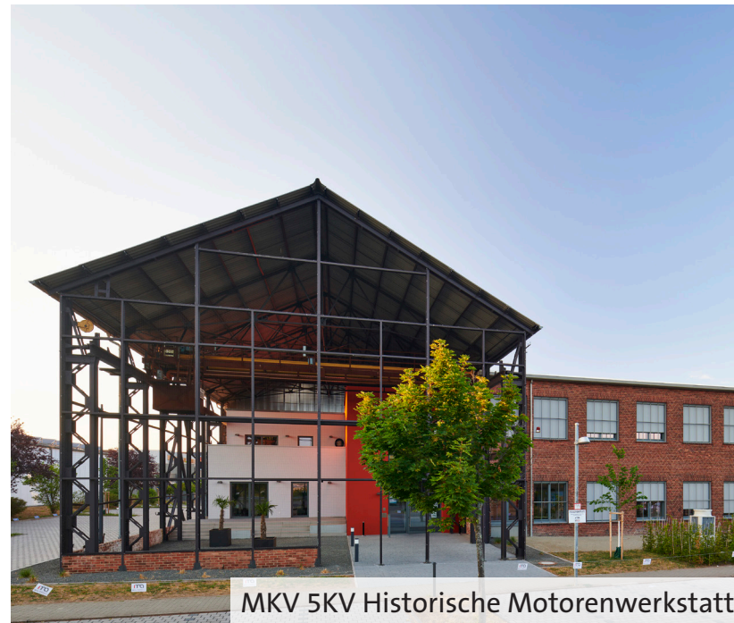
MKV 5KV Historische Motorenwerkstatt