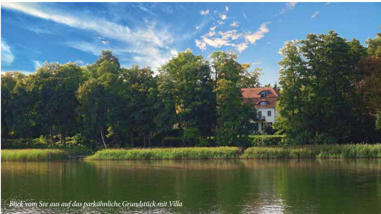
Blick vom See aus auf das parkähnliche Grundstück mit Villa

Auf dem Villengrundstück entstehen zwei zeitgenössische Mehrfamilienhäuser. Die Gartensauna und der Seezugang vom hauseigenen Steg garantieren Entspannung.