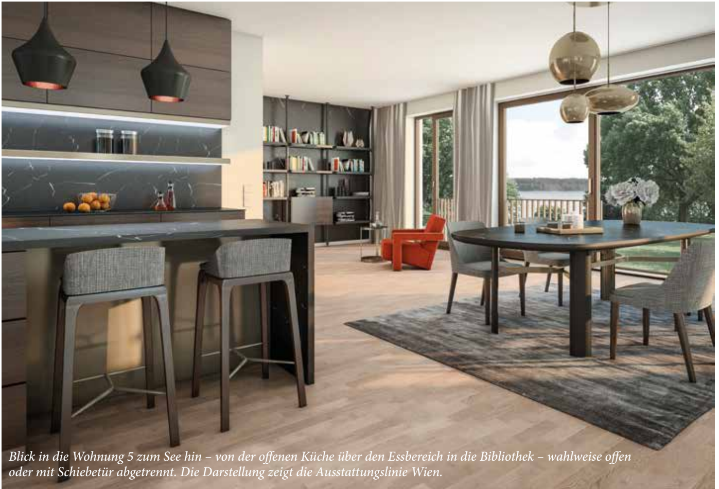
Blick in die Wohnung 5 zum See hin – von der offenen Küche über den Essbereich in die Bibliothek – wahlweise offen oder mit Schiebetür abgetrennt. Die Darstellung zeigt die Ausstattungslinie Wien.