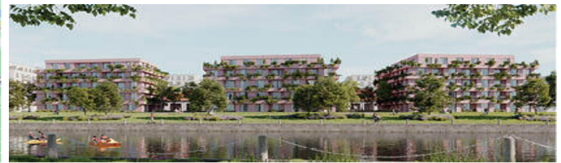
Visualisierung | Quartier