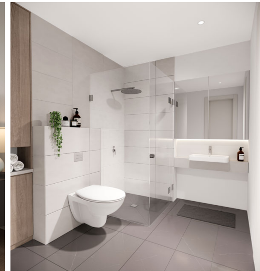
Visualisierungen | Mögliche Innenausstattung