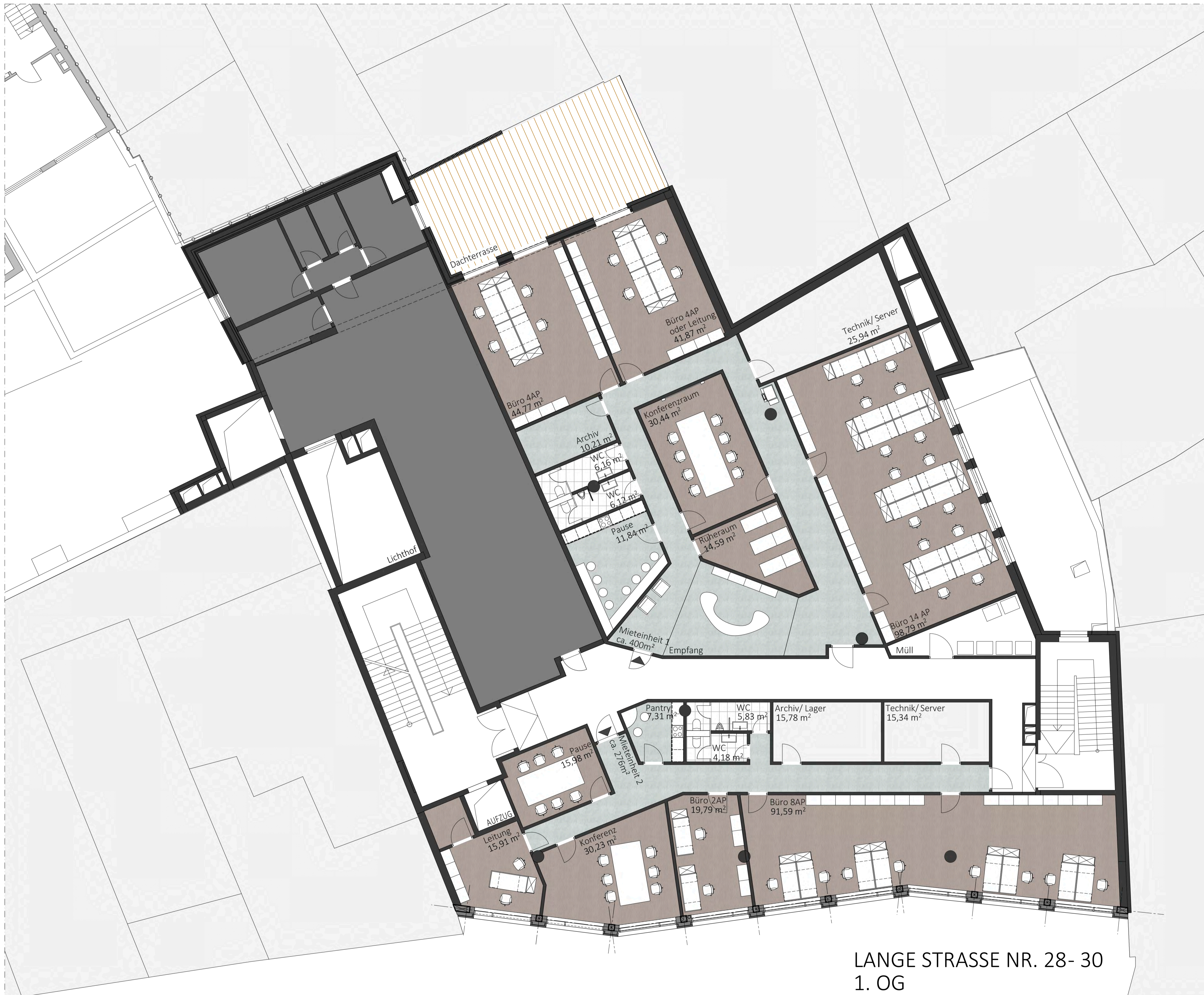
LANGE STRASSE NR. 28- 30 1. OG