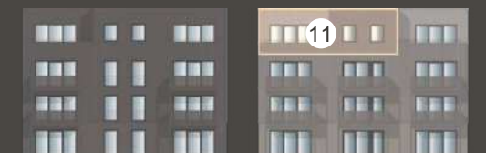
HAUS FAGATTO 6.2