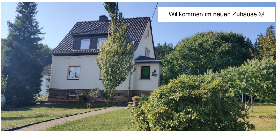
Willkommen im neuen Zuhause ☺