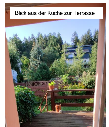
Blick aus der Küche zur Terrasse