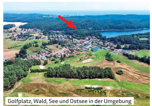
Golfplatz, Wald, See und Ostsee in der Umgebung