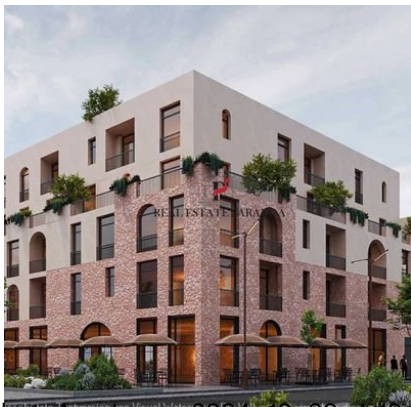
WhatsApp image 2024-12-09 at 12.15.42 (5).jpeg