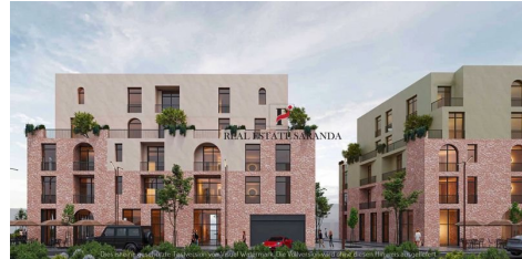
WhatsApp Image 2024-12-09 at 12.15.42 (4).jpeg