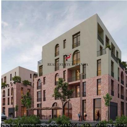
WhatsApp image 2024-12-09 at 12.15.42 (3).jpeg