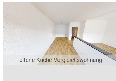
offene Küche Vergleichswohnung