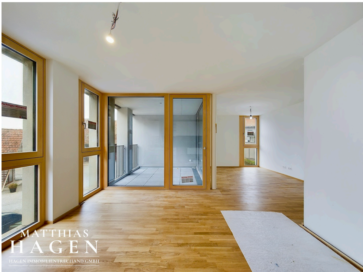
Wohnbereich mit Küche