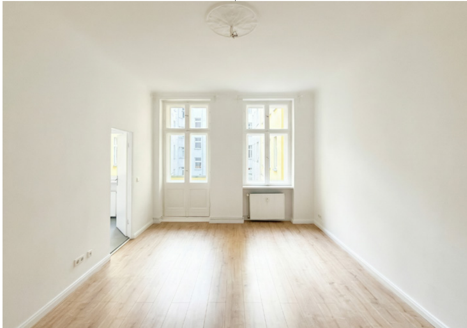
Unverbindliches Wohnungsbeispiel | Non-binding flat example