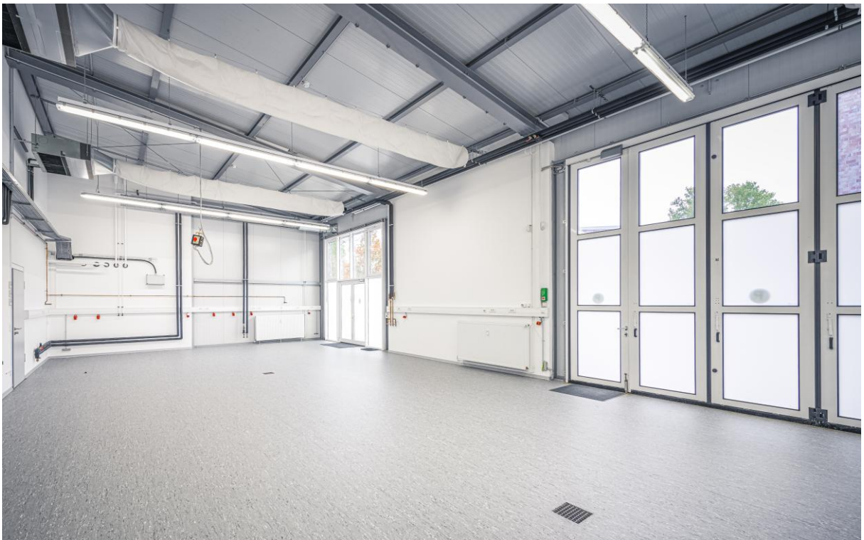
Produktionshalle (ca. 136 m 2 )