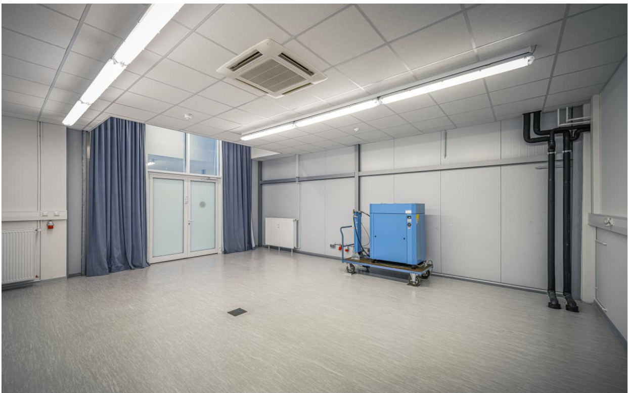
Labor (ca. 58 m 2 )