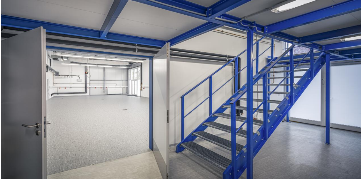
Lager (ca. 38 m 2 zzgl. 2. Ebene)