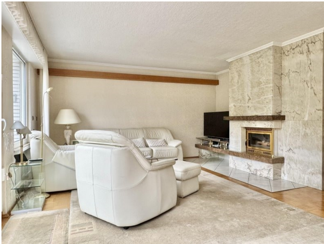
Wohnzimmer mit Blick auf Kamin