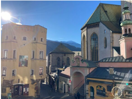
Aussicht Richtung Süden