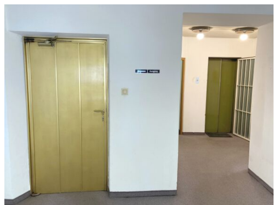
Eingangs- & Ausgangsbereich