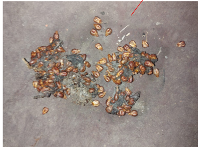
Zu 5.8: Kotspuren