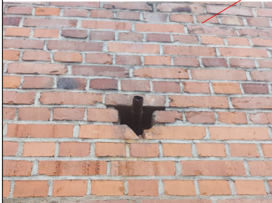
Zu 5.9: Höhlen und Spalten am Altbau