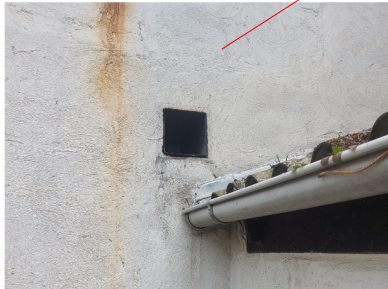
Zu 5.9: Höhlen und Spalten am Altbau