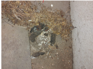
Zu 5.8: Kotspuren