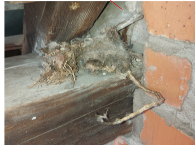
Zu 5.8: Tierrest - tote Ratte