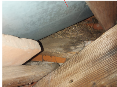
Zu 5.8: Nest unbewohnt