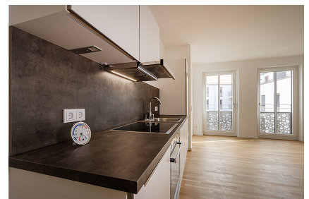
Wohnen mit offener Einbauküche