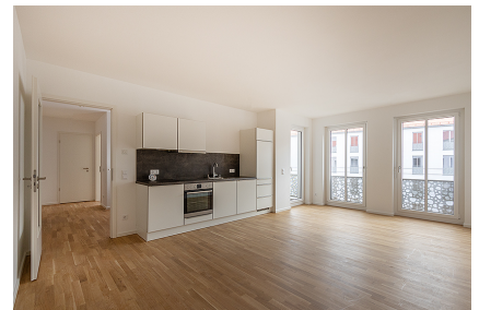
Wohnzimmer mit offener Küche