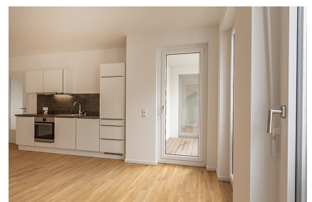
beidseitig begehbarer Balkon