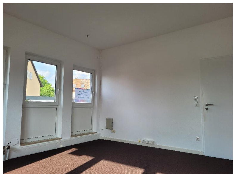
Laut Grundrissplan Sekretariat