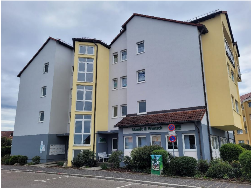
Wohn- und Geschäftshaus... Ihre gute Adresse