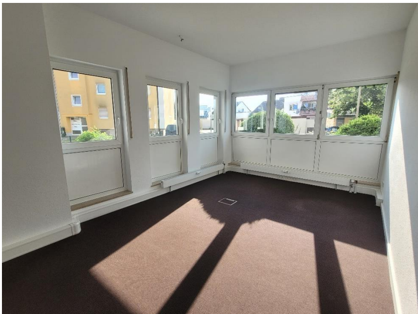
Büro 3 laut Grundrissplan Chef