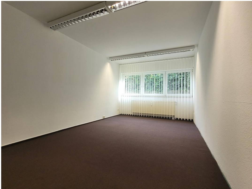
Büro 4 oder Besprechungsraum im UG