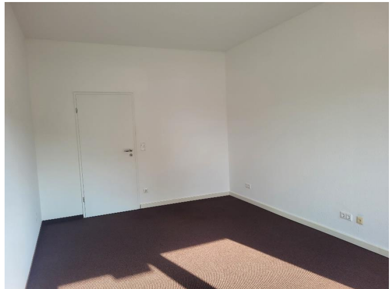
Büro 2 in der Mitte