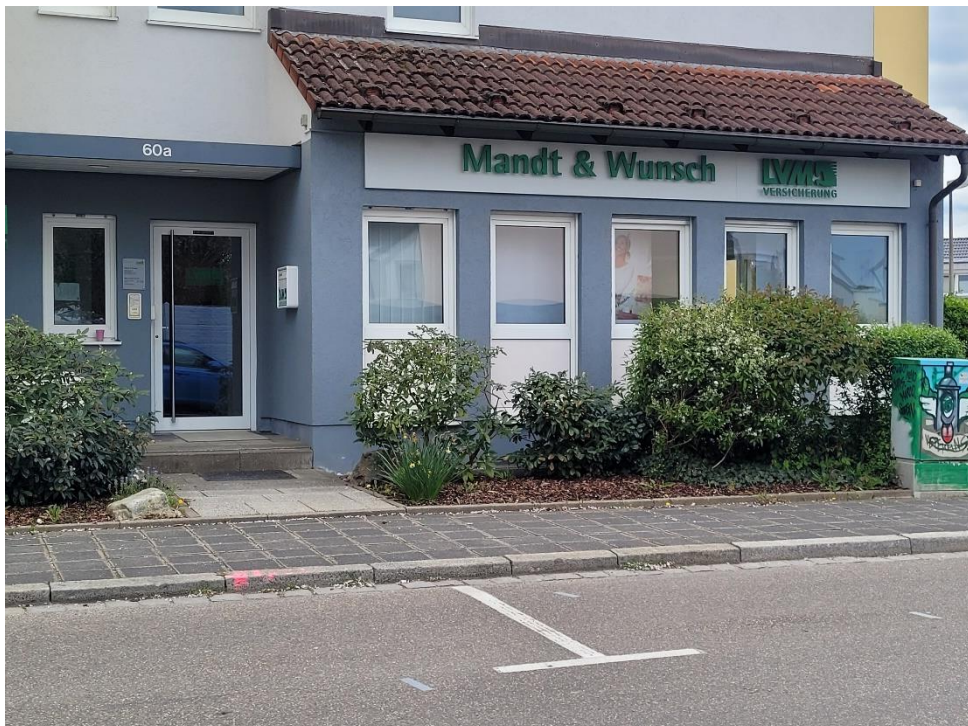
Büroeingang von der Straße