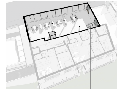
Top A01 - Haus A - EG