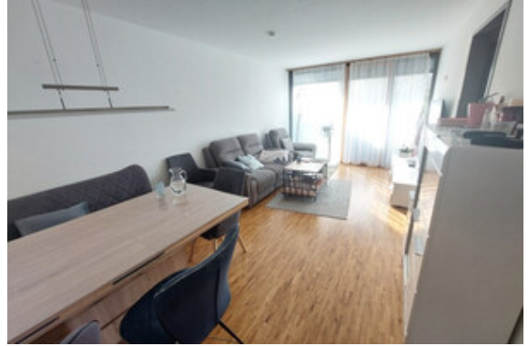
Essen / Wohnen