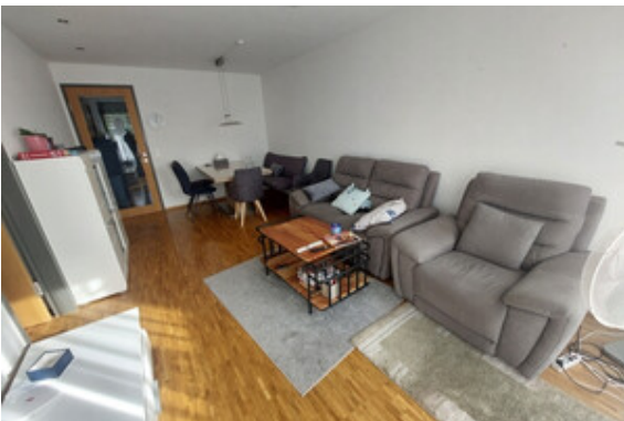
Essen / Wohnen