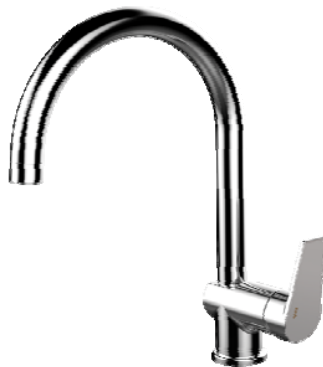
Monomando en fregadero de cocina