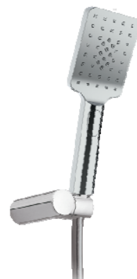
Kit ducha soporte más mango suki