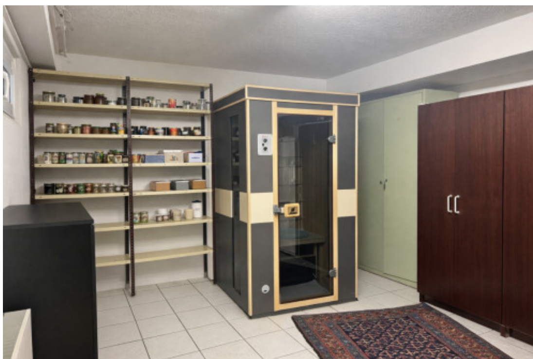
Keller 2 Sauna