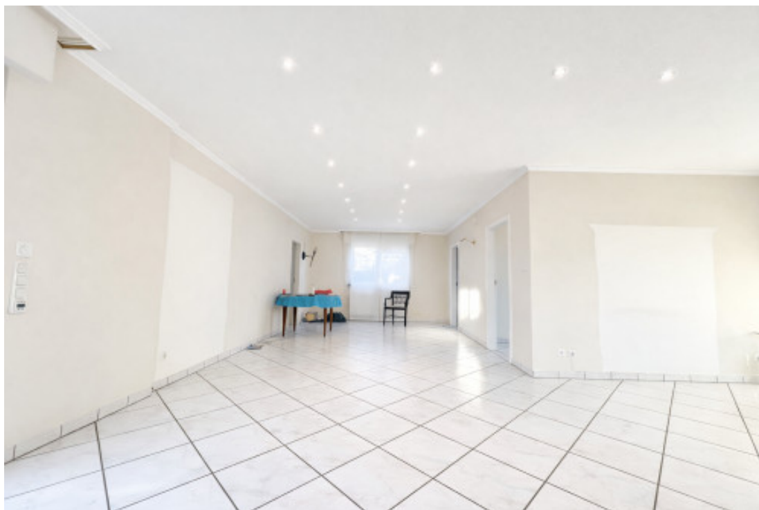
Wohnzimmer teil 2