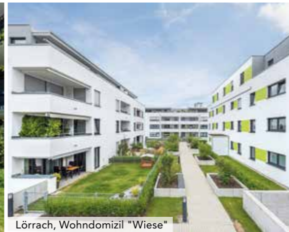
Lörrach, Wohndomizil "Wiese"