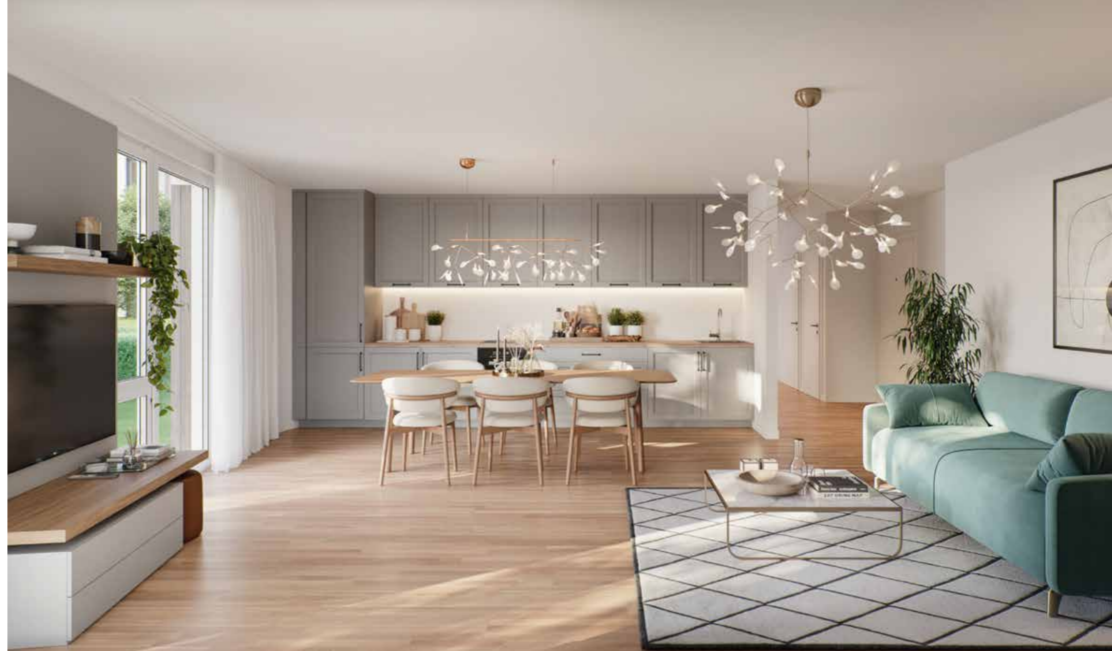
unverbindliche Visualisierungen – enthalten Sonderwunschausstattung