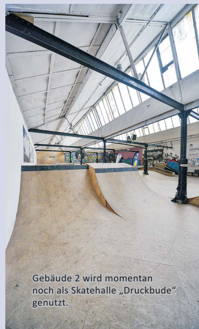
Gebäude 2 wird momentan noch als Skatehalle „Druckbude“ genutzt.