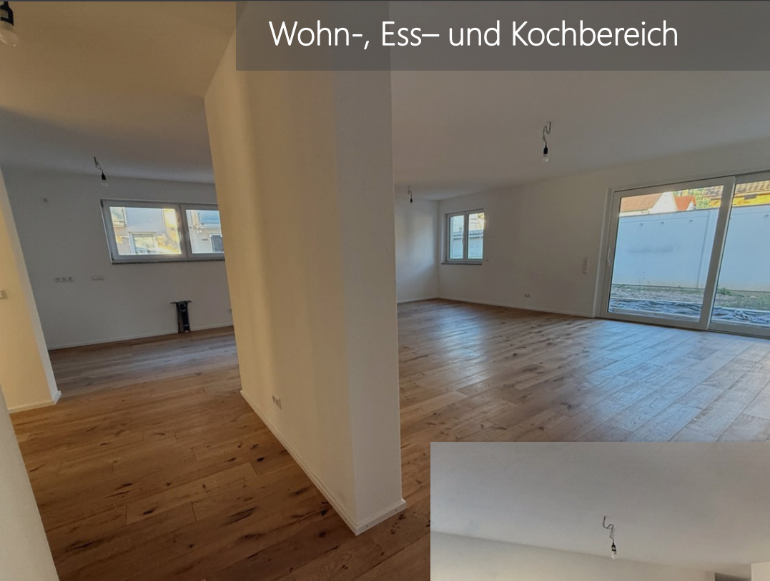
Wohn-, Ess- und Kochbereich