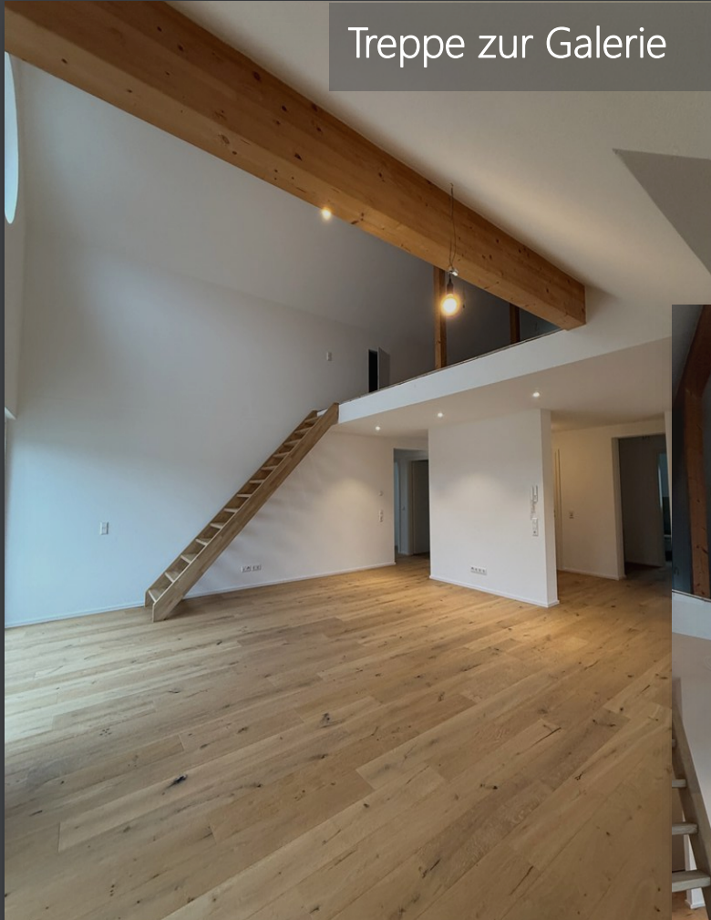
Treppe zur Galerie