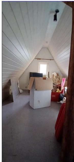
Speicher (= DG)