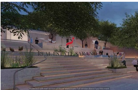
Green Coast II Brochure_page-0048.jpg