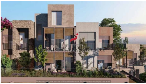
Green Coast II Brochure_page-0036.jpg