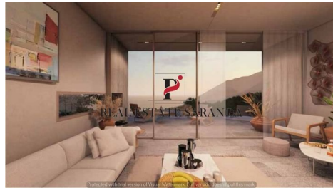
Green Coast II Brochure_page-0039.jpg