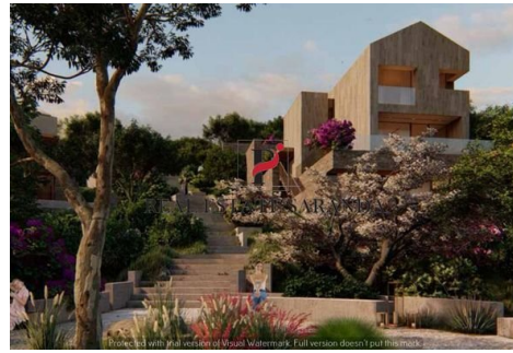
Green Coast II Brochure_page-0052.jpg