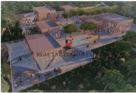
Green Coast II Brochure_page-0053.jpg