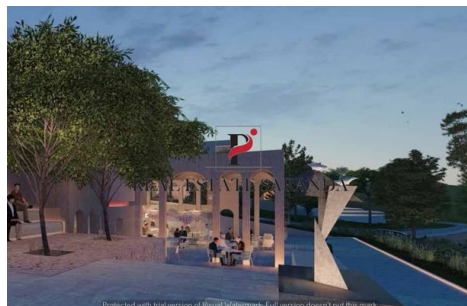
Green Coast II Brochure_page-0049.jpg