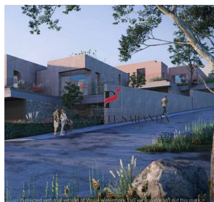
Green Coast II Brochure_page-0033.jpg