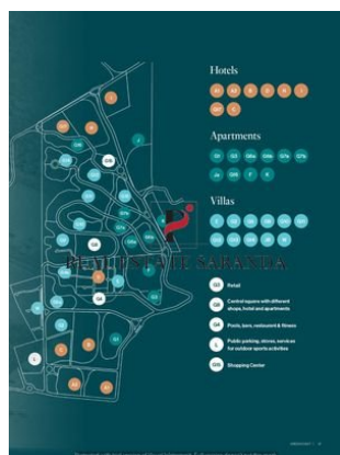
Green Coast II Brochure_page-0027.jpg