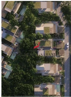
Green Coast II Brochure_page-0041.jpg