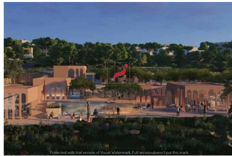
Green Coast II Brochure_page-0046.jpg