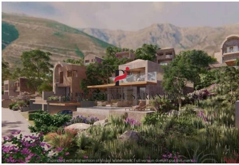
Green Coast II Brochure_page-0051.jpg