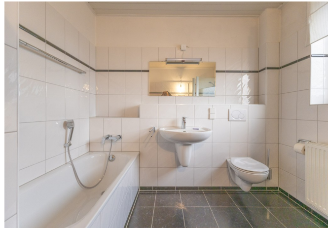
Tageslichtbad mit Badewanne und Dusche