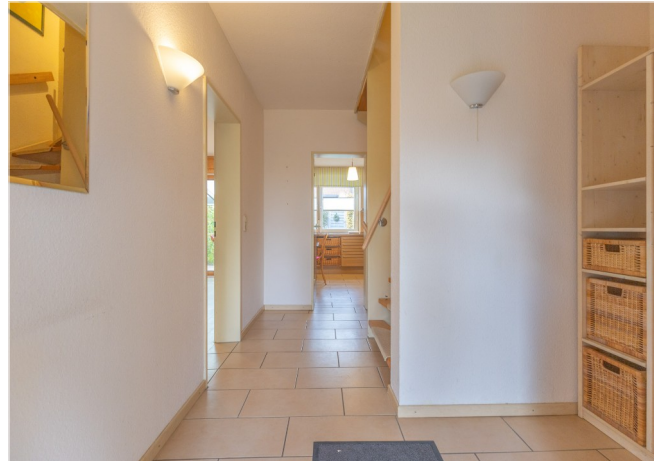
Diele im EG