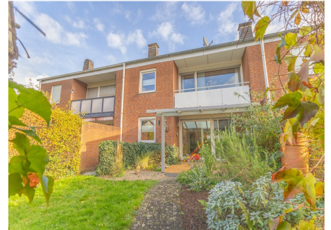
Haus & Gartenansicht