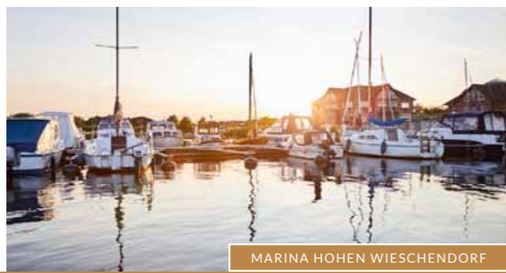
MARINA HOHEN WIESCHENDORF