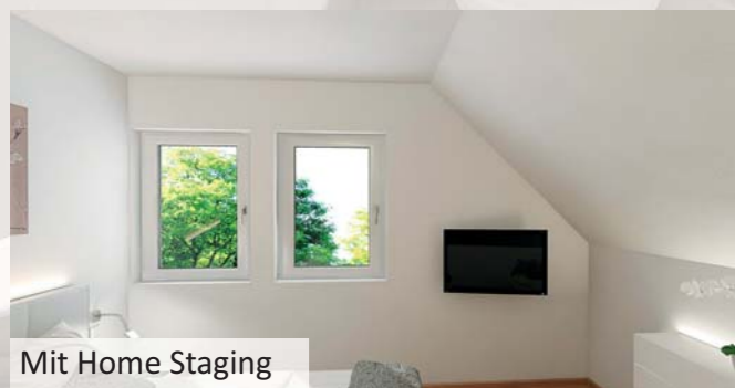
Mit Home Staging