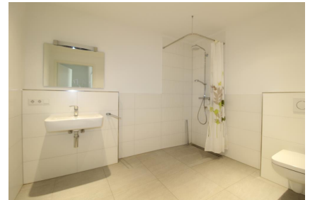
Bad mit ebenerdiger Dusche

Weitere interessante Angebote finden Sie unter www.capera-immobilien.de .