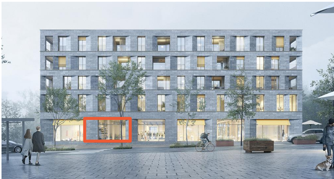
Ansicht, Mietfläche EG (Visualisierung Gebäude)