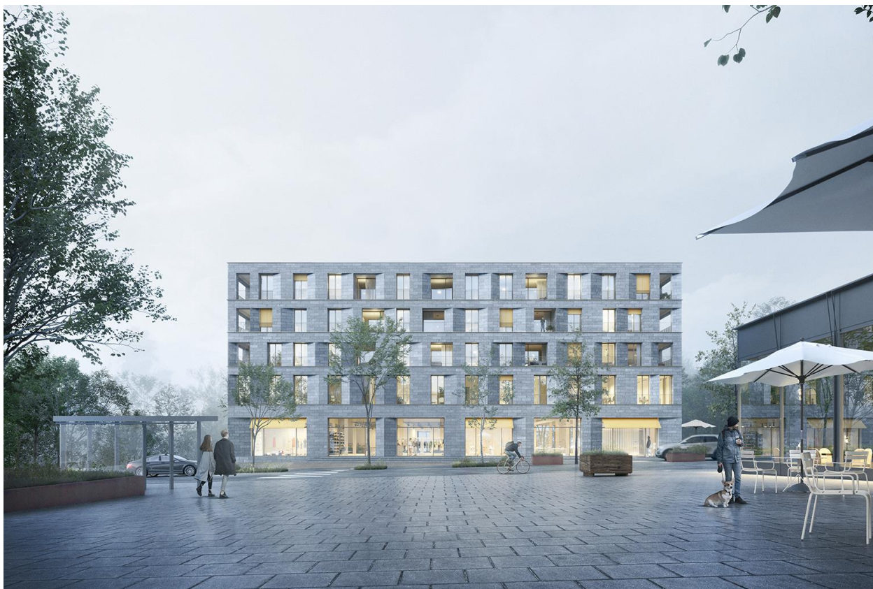
Visualisierung Gebäude Am Garnmarkt 17, südseitig (von der Flanierzone)