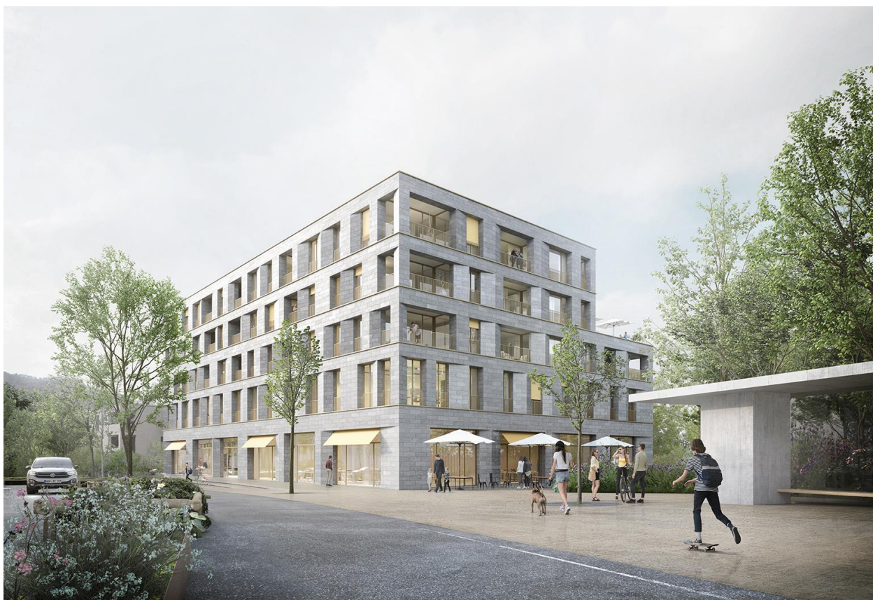
Visualisierung Gebäude Am Garnmarkt 17, ostseitig (neue Bushaltestelle)