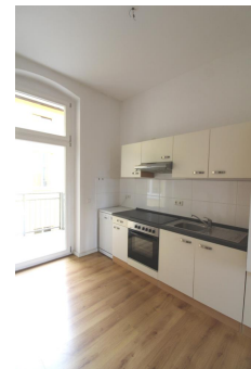
Küche mit Einbauküche