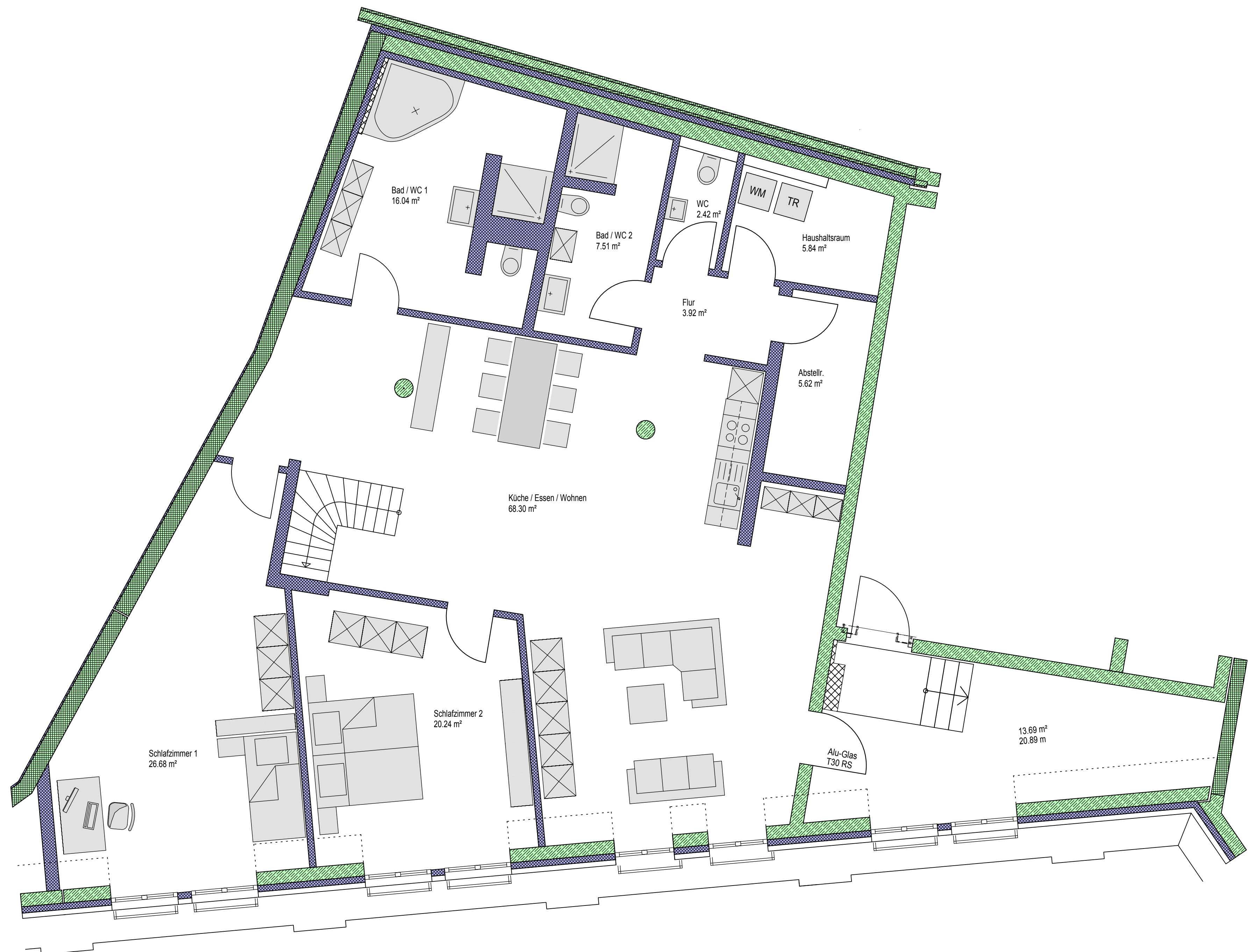
WOHNUNG 31 5.OBERGESCHOSS