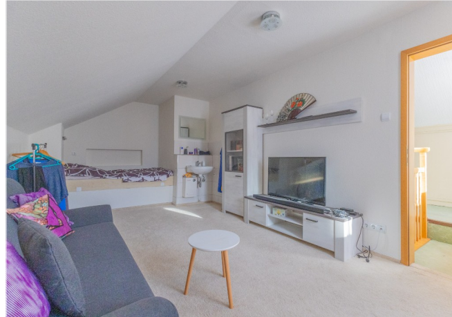
Ausgebauter Raum im DG