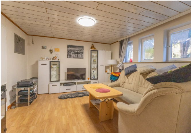
2tes Schlafzimmer UG