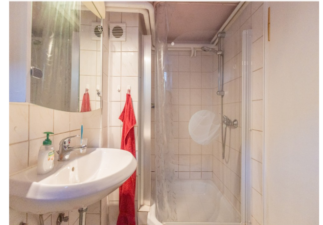
Bad im UG