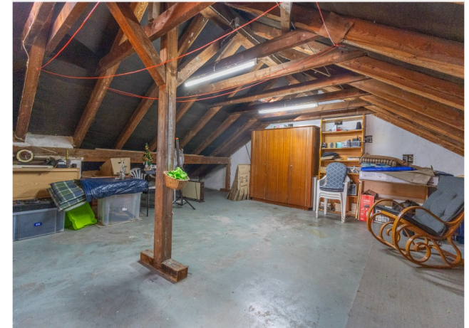
Dachbodenbereich (könnte noch ausgebaut werden)