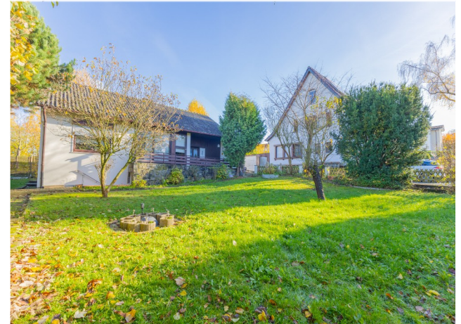
Hausansichten und Grundstücksbereich