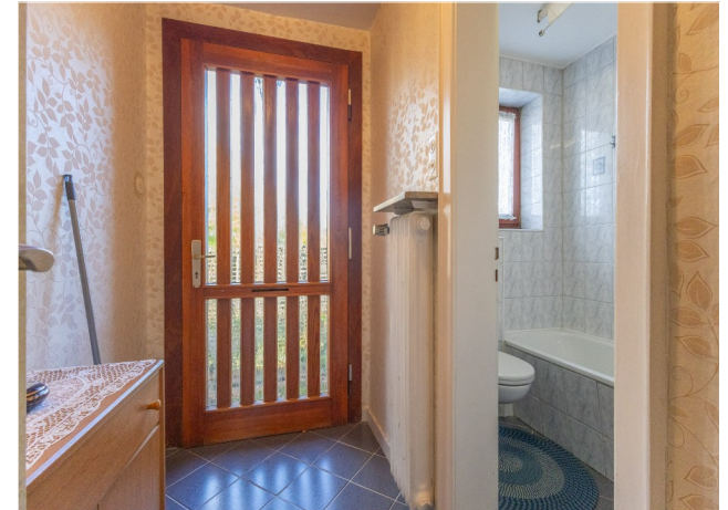
Eingangsbereich im EG