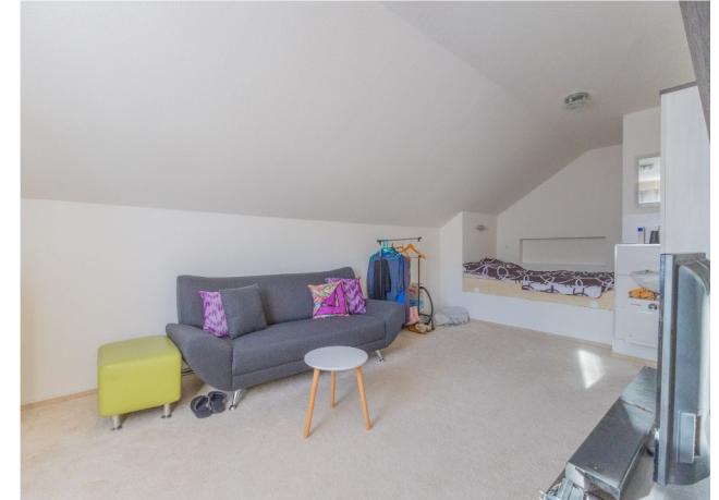
Schlafzimmer im DG