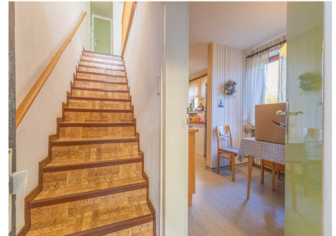
Treppenaufgang ins DG