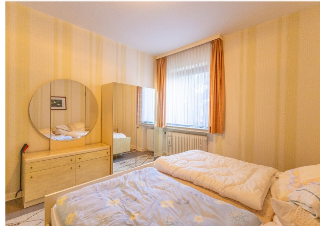
Schlafzimmer im EG