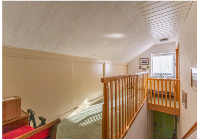
Diele im DG