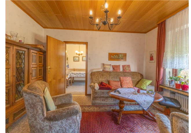
Kleines Wohnzimmer im EG