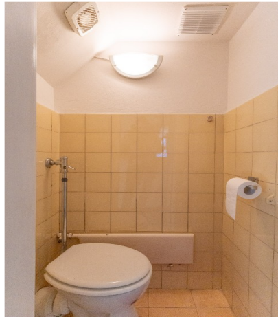
GWC im DG