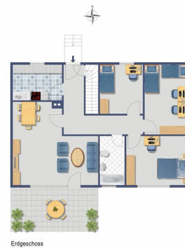
Grundriss EG ursprünglich