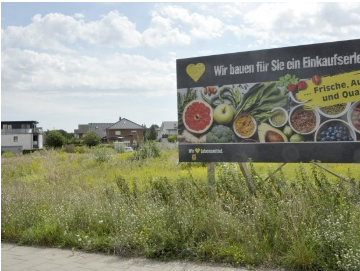
Hier soll ein Edeka-Markt gebaut werden: auf dem Baufeld 3, südlich der „Neuen Lammer Mitte“