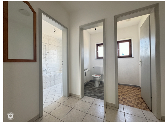
WC und Abstellkammer