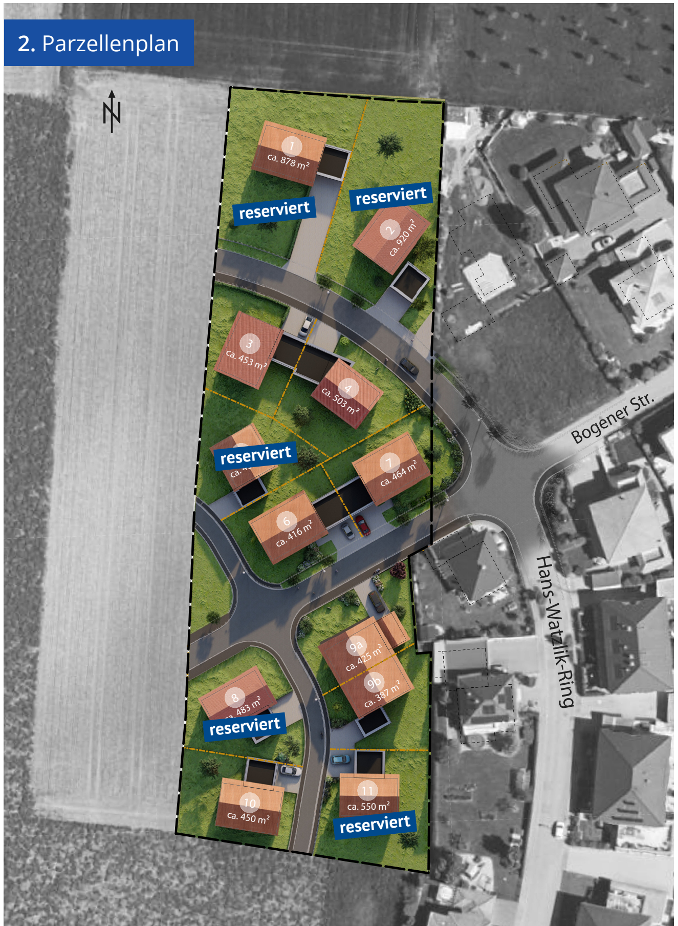
Abb. Visualisierung Bebauungsbeispiele