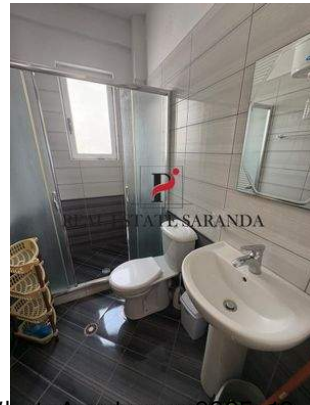
WhatsApp Image 2025-10-13 at 14.07.56.jpeg