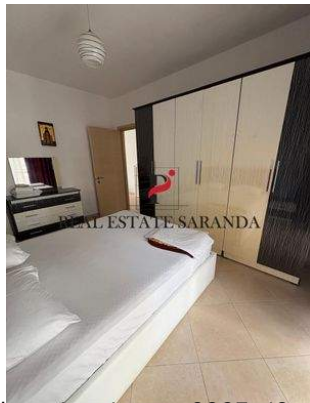
WhatsApp Image 2025-10-13 at 14.08.11.jpeg