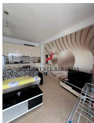
WhatsApp Image 2025-10-13 at 14.07.38 (1).jpeg