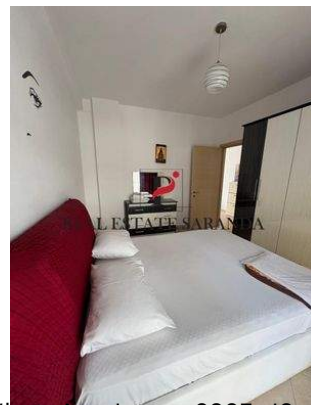
WhatsApp Image 2025-10-13 at 14.08.14.jpeg