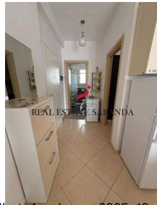
WhatsApp Image 2025-10-13 at 14.07.59.jpeg