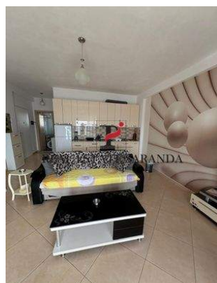
WhatsApp Image 2025-10-13 at 14.07.35 (1).jpeg