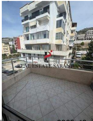
WhatsApp Image 2025-10-13 at 14.08.16.jpeg