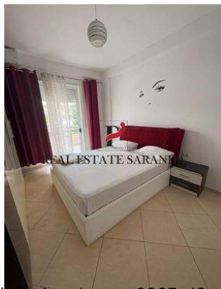
WhatsApp Image 2025-10-13 at 14.08.02.jpeg