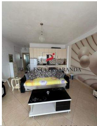
WhatsApp Image 2025-10-13 at 14.07.42.jpeg