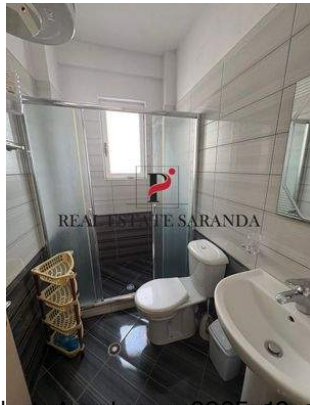
WhatsApp Image 2025-10-13 at 14.07.53.jpeg