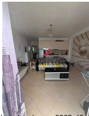
WhatsApp Image 2025-10-13 at 14.08.37.jpeg