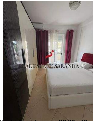
WhatsApp Image 2025-10-13 at 14.08.10.jpeg