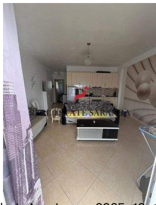
WhatsApp Image 2025-10-13 at 14.08.38.jpeg