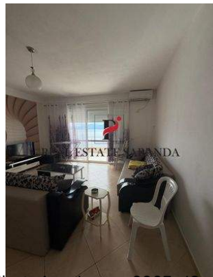
WhatsApp Image 2025-10-13 at 14.07.31.jpeg