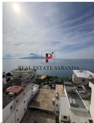
WhatsApp Image 2025-10-13 at 14.08.32 (1).jpeg