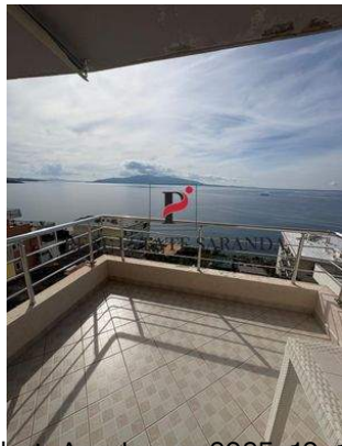
WhatsApp Image 2025-10-13 at 14.08.28.jpeg