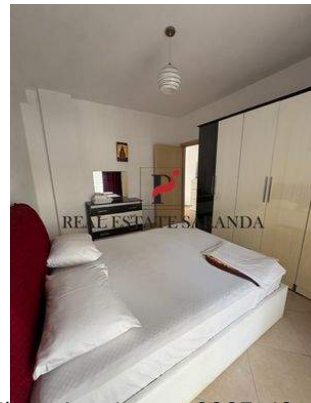
WhatsApp Image 2025-10-13 at 14.08.13.jpeg