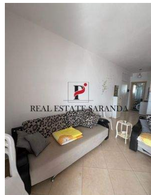
WhatsApp Image 2025-10-13 at 14.07.47.jpeg