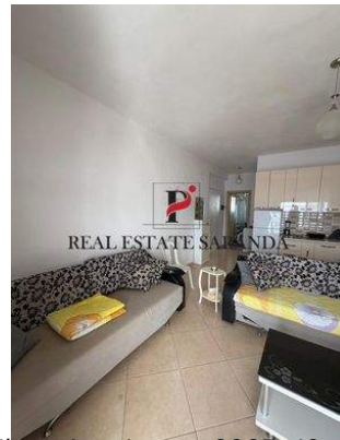
WhatsApp Image 2025-10-13 at 14.07.44 (1).jpeg