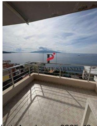
WhatsApp Image 2025-10-13 at 14.08.30.jpeg