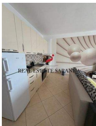
WhatsApp Image 2025-10-13 at 14.07.33.jpeg