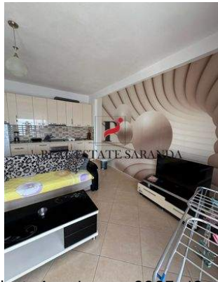
WhatsApp Image 2025-10-13 at 14.07.38.jpeg