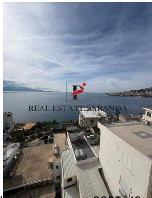
WhatsApp Image 2025-10-13 at 14.08.32.jpeg