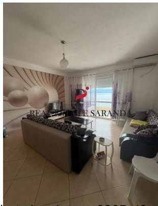
WhatsApp Image 2025-10-13 at 14.07.28.jpeg