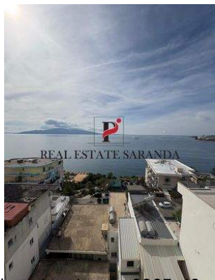
WhatsApp Image 2025-10-13 at 14.08.31.jpeg