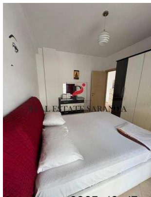
WhatsApp Image 2025-10-13 at 14.08.14 (1).jpeg