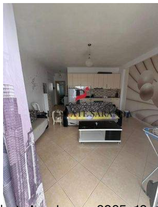
WhatsApp Image 2025-10-13 at 14.08.37 (1).jpeg