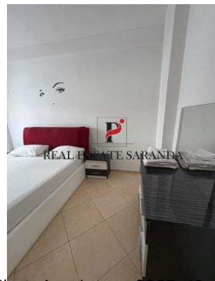
WhatsApp Image 2025-10-13 at 14.08.07.jpeg