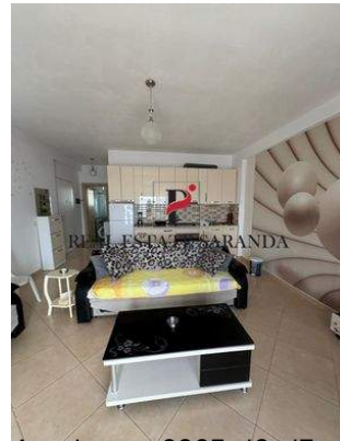
WhatsApp Image 2025-10-13 at 14.07.42 (1).jpeg