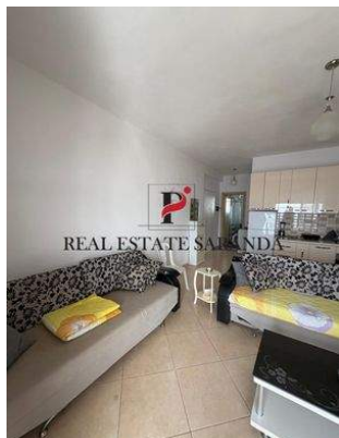
WhatsApp Image 2025-10-13 at 14.07.44.jpeg