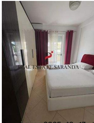
WhatsApp Image 2025-10-13 at 14.08.10 (1).jpeg