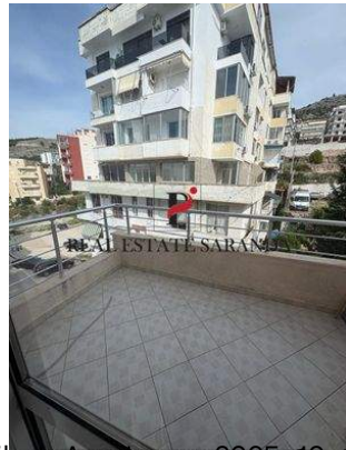
WhatsApp Image 2025-10-13 at 14.08.26.jpeg