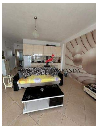
WhatsApp Image 2025-10-13 at 14.07.35.jpeg