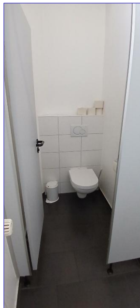
4. OG WC