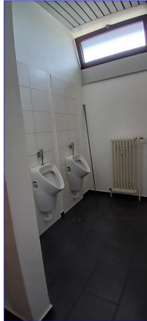
4. OG WC