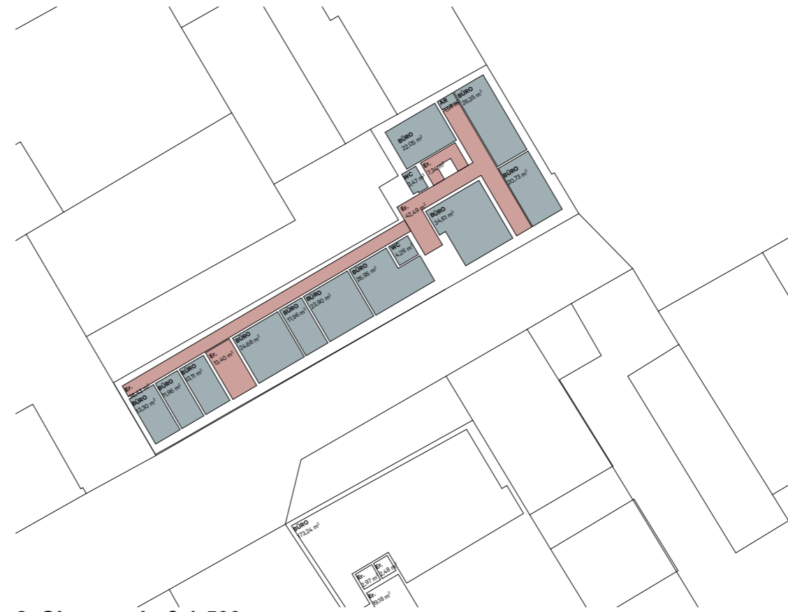
2. Obergeschoß 1:500