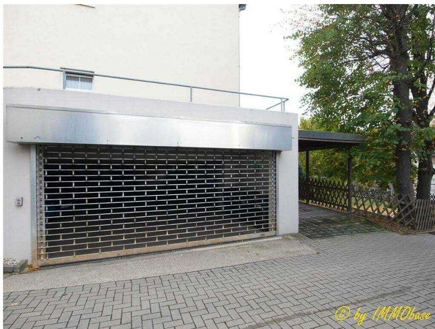
Parkplatz in der Tiefgarage