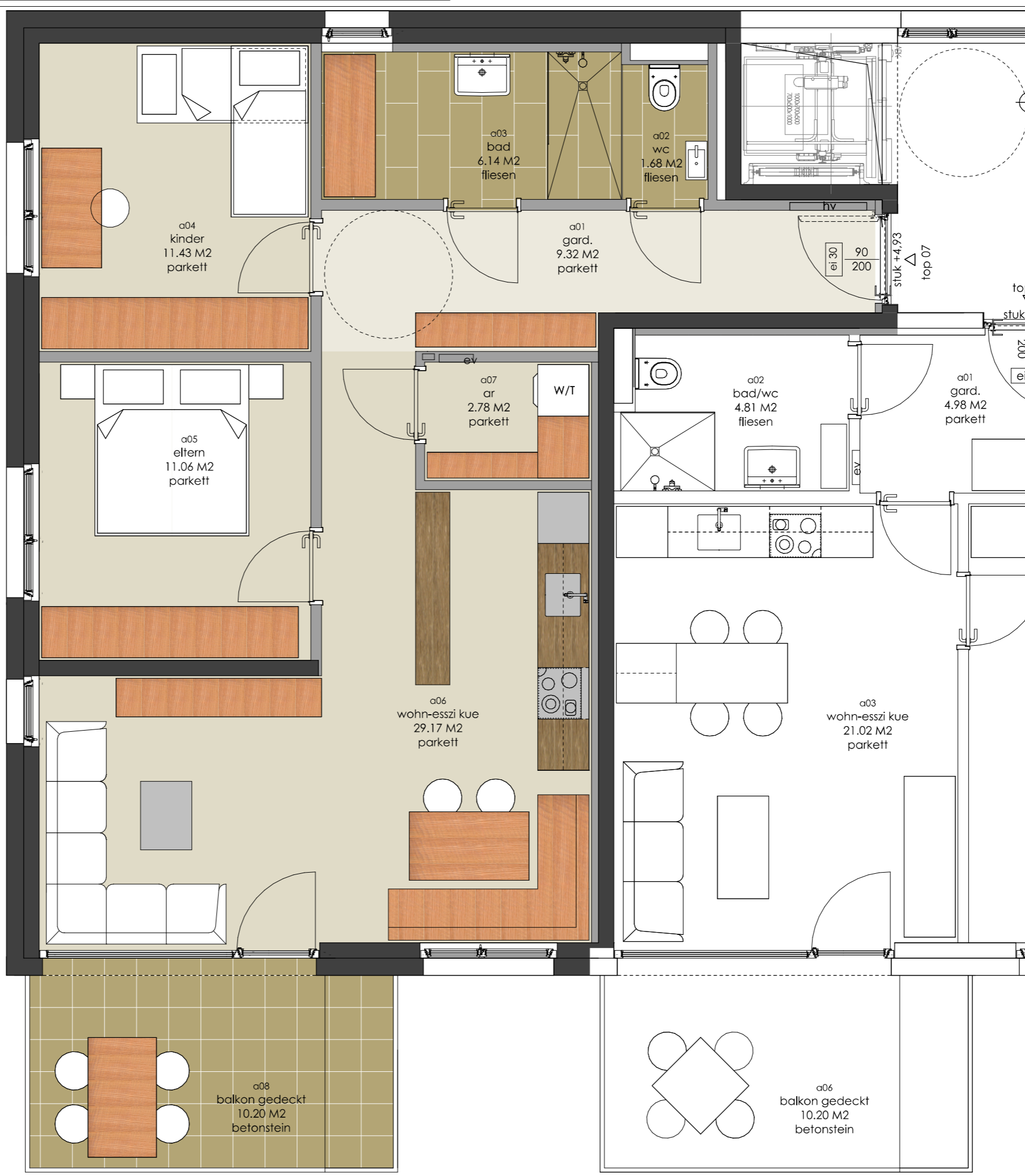
3-ZI WOHLG. 71,58 M2