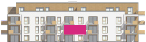
Haus A - Ansicht Süd