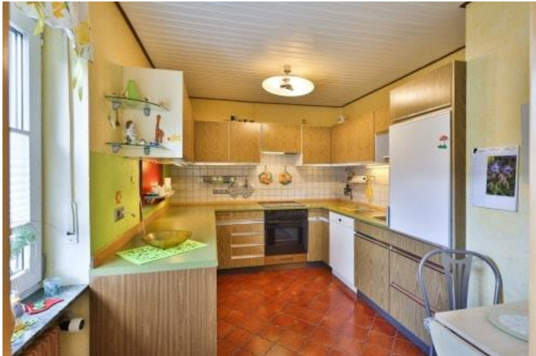
Küche - EG