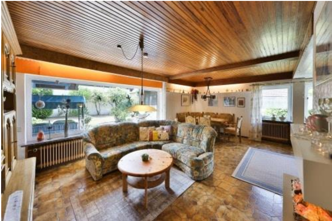
Wohn- und Essbereich mit Blick auf die Terrasse - EG