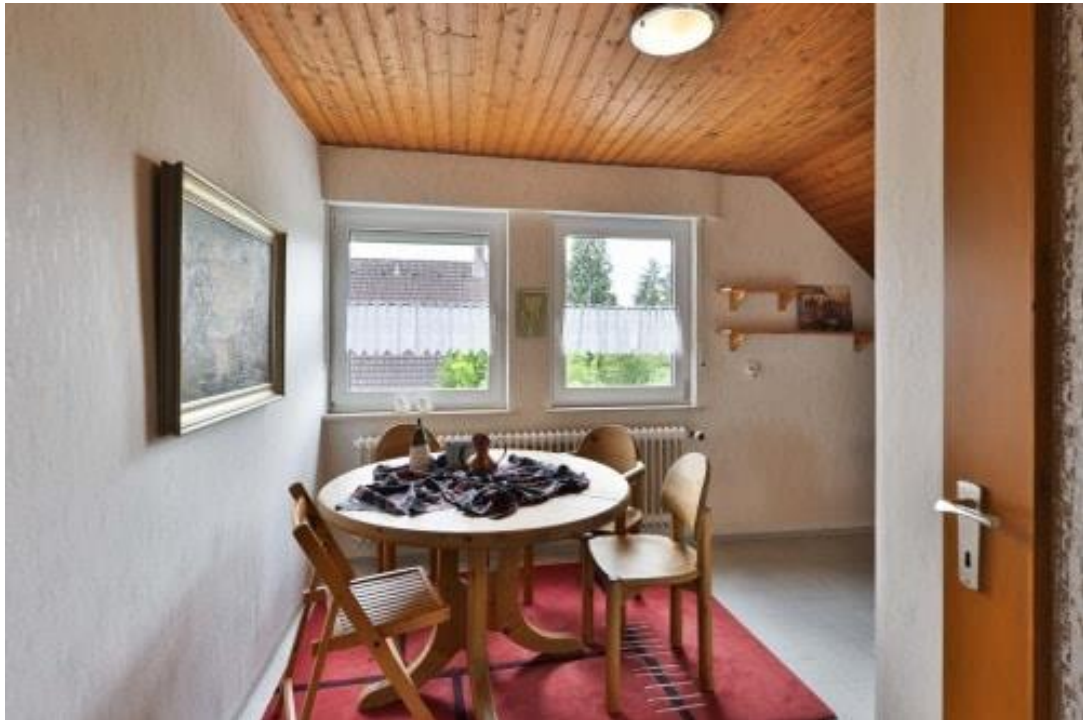
Küche - Essplatz - DG