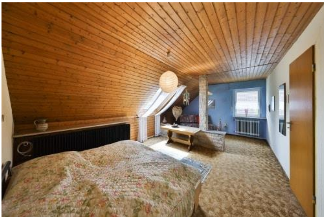
Wohnzimmer - DG