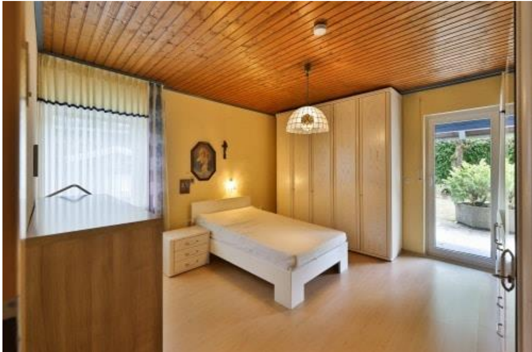
Schlafzimmer - EG