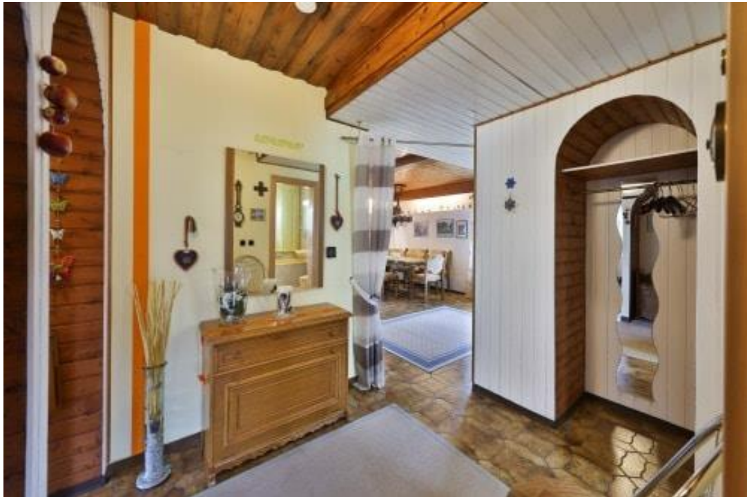
Diele - EG