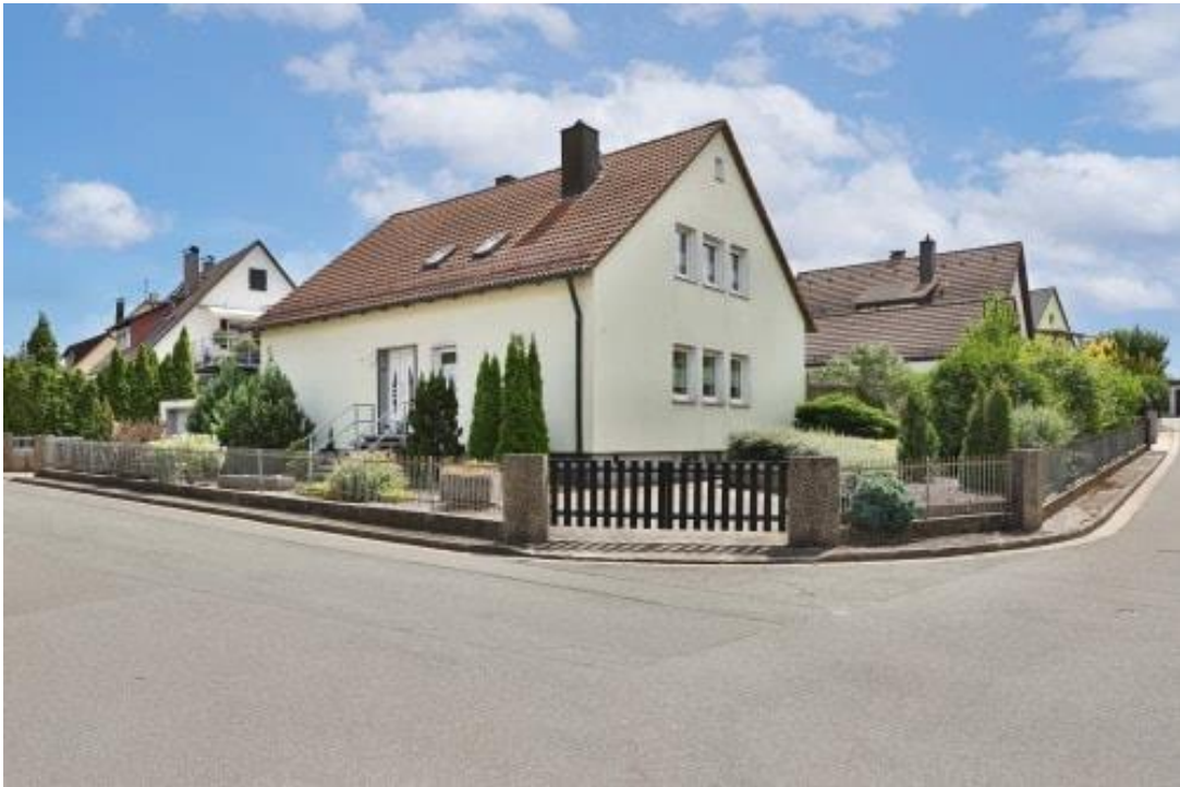
Hausansicht - Eingang- und Giebelseite