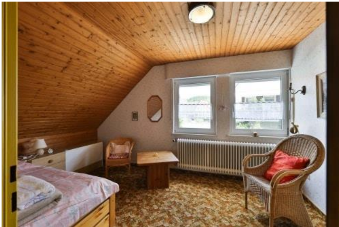
Schlafzimmer - DG