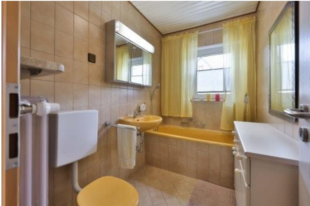
Badezimmer - EG