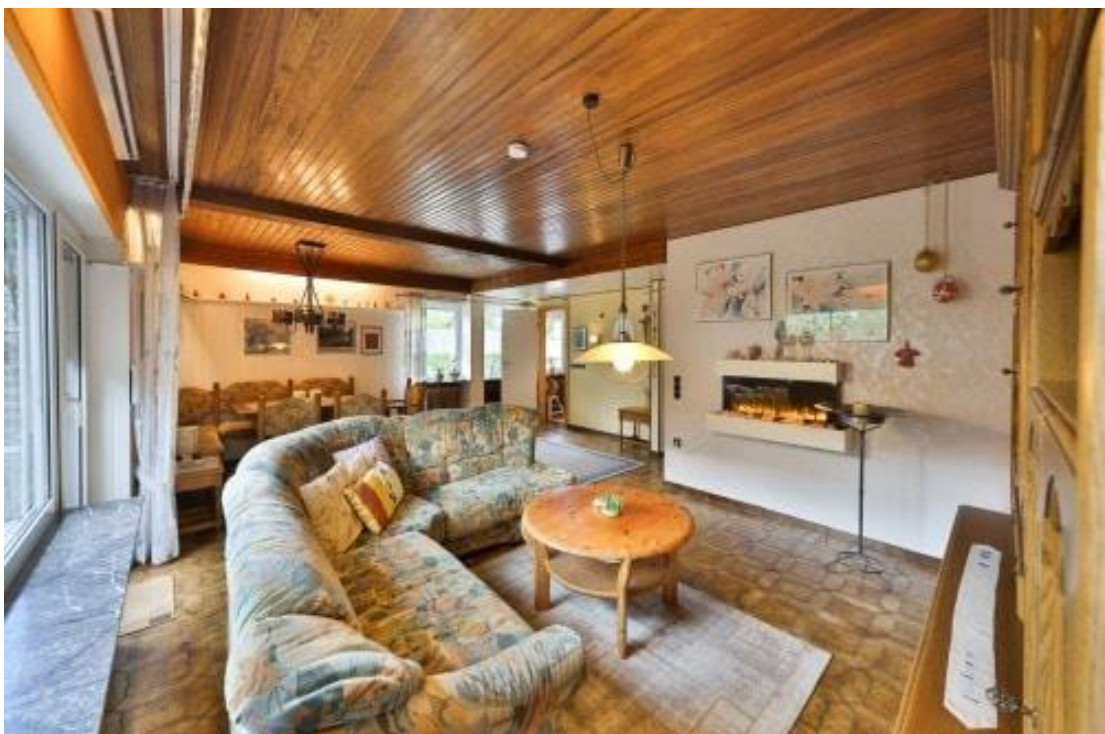
Wohn- und Essbereich - EG