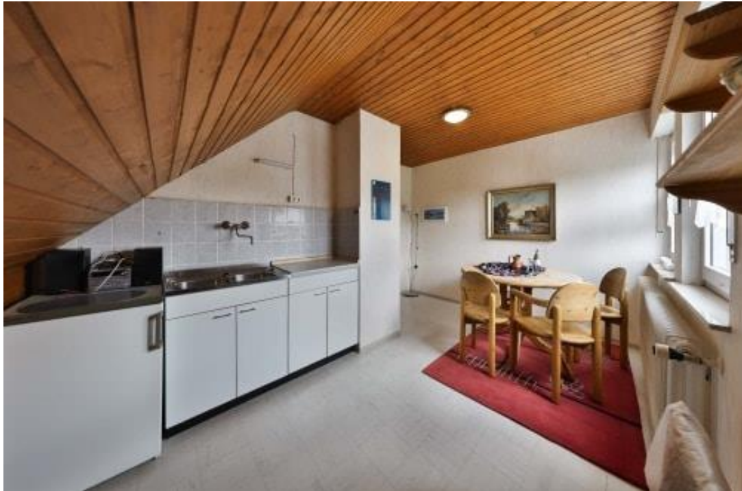
Küche - DG