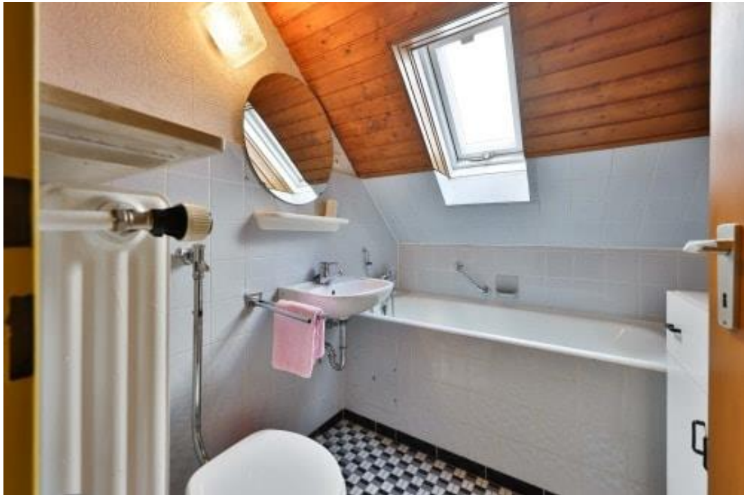
Badezimmer - DG