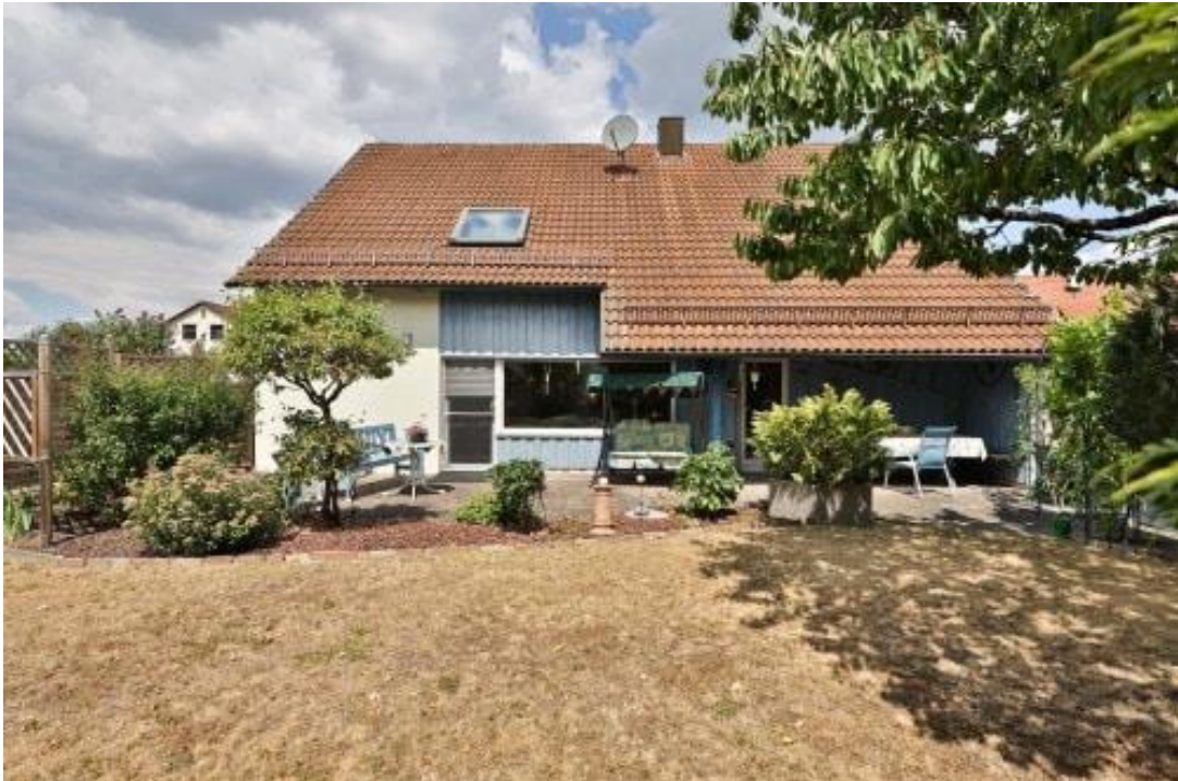
Hausansicht mit Terrasse