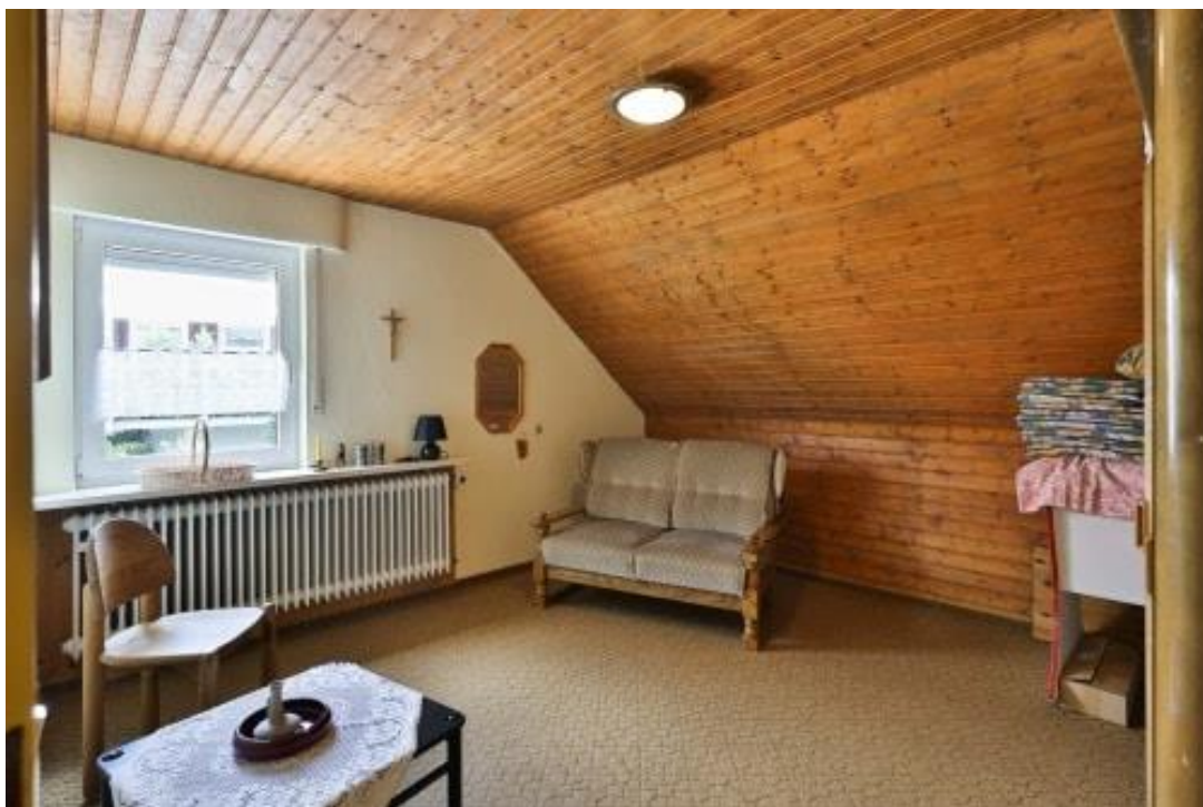
Zimmer - DG