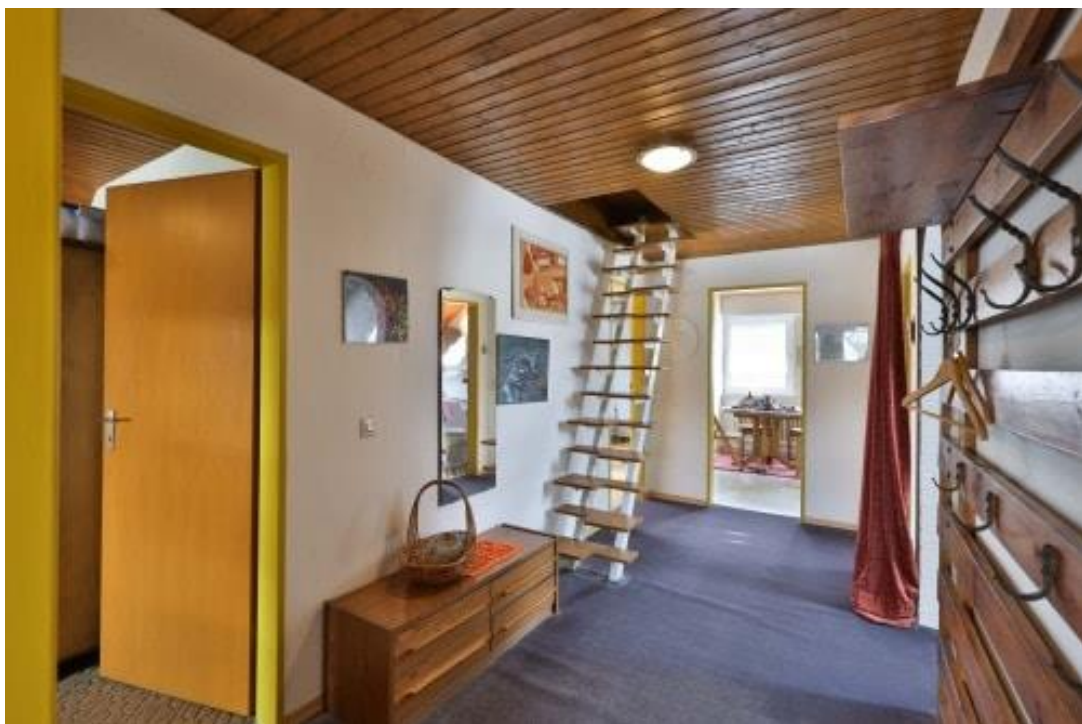
Flur - DG