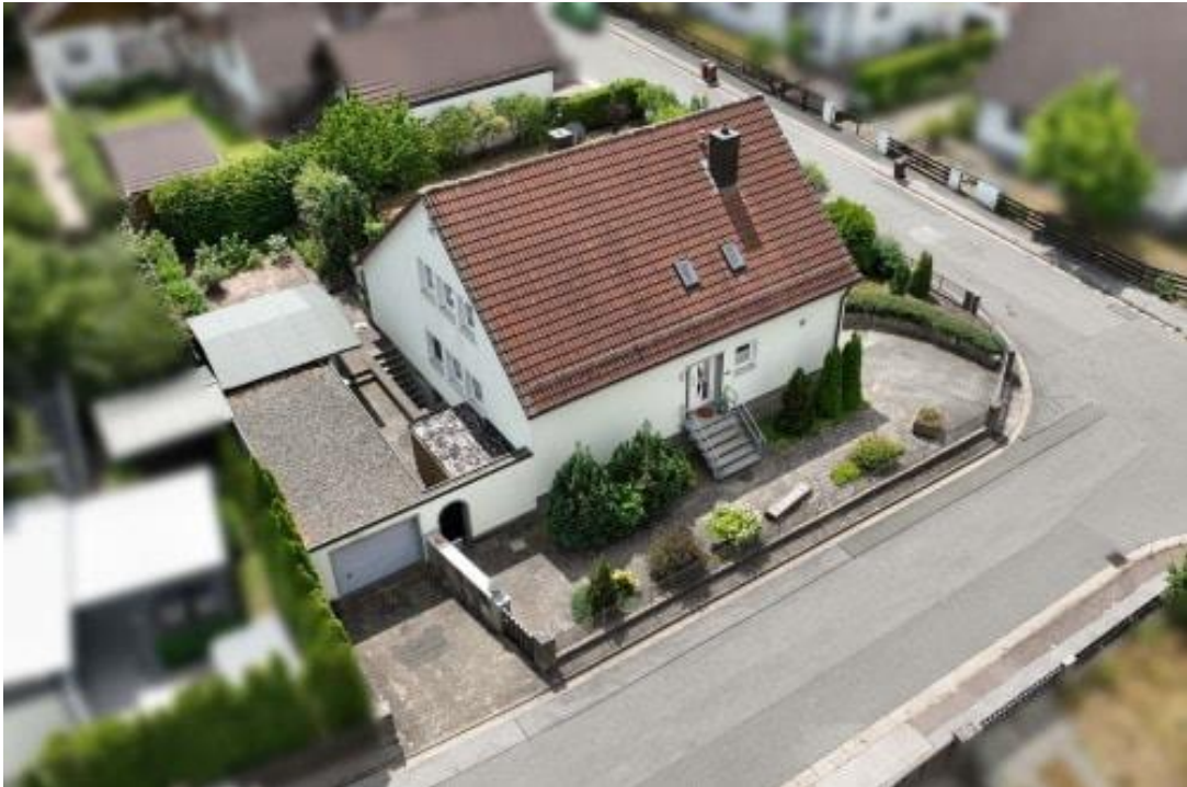
Hausansicht von oben mit Garage