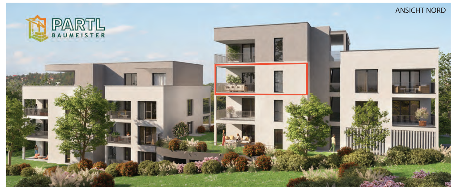
BK 2 ERDGESCHOSS