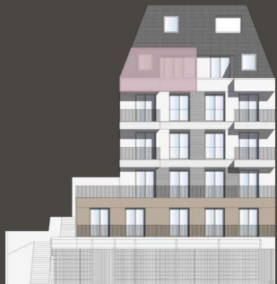
Ansicht von Nordwesten (Gartenseite)