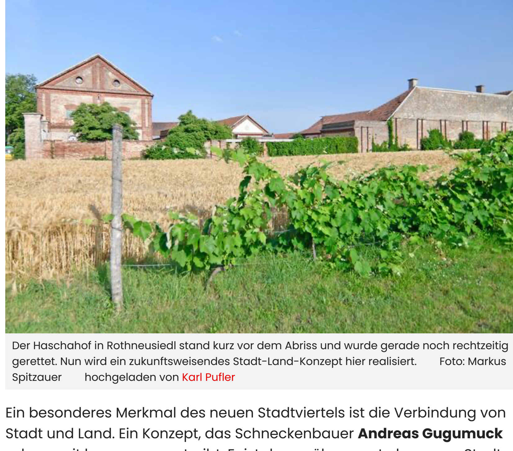
Der Haschahof in Rothneusiedl stand kurz vor dem Abriss und wurde gerade noch rechtzeitig gerettet. Nun wird ein zukunftsweisendes Stadt-Land-Konzept hier realisiert.

Geplant ist bereits, dass ein Drittel des Gebiets – das sind rund 40 Hektar – Grün- und Freifläche bleiben. Auch eine Grünbrücke bis zum Liesingbach ist bereits angekündigt worden. Diese sollen eine Vernetzung zu den landwirtschaftlichen Gebieten im Süden Favoritens schaffen. 90 Prozent der aktuell bestehenden Grünflächen sollen dauerhaft gesichert werden.