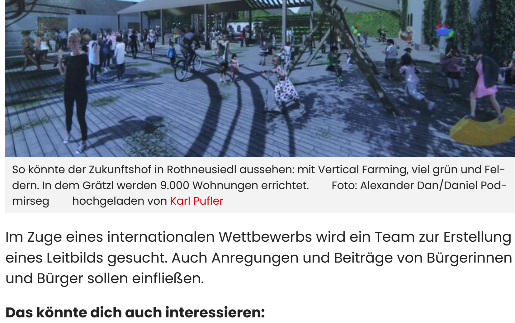
So könnte der Zukunftshof in Rothneusiedl aussehen: mit Vertical Farming, viel grün und Feldern. In dem Grätzl werden 9.000 Wohnungen errichtet.