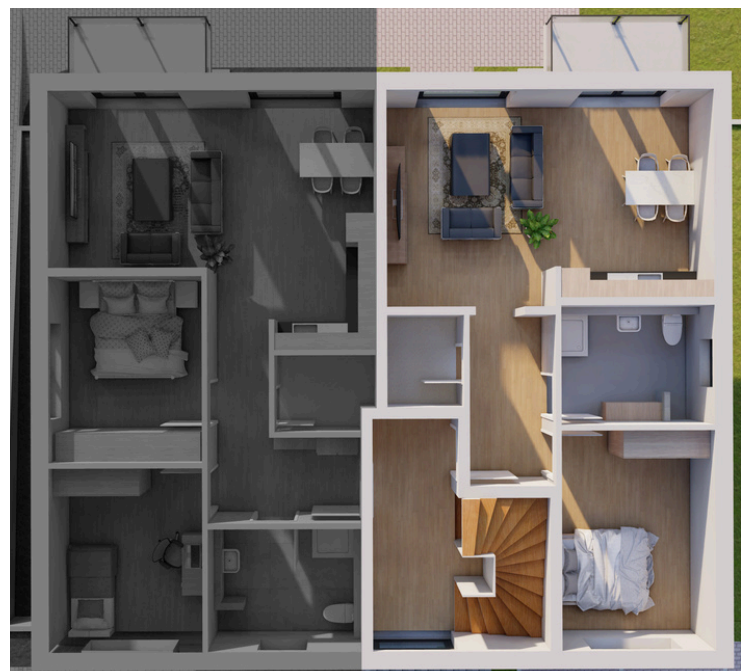
Obergeschoss Wohnung Nummer 5